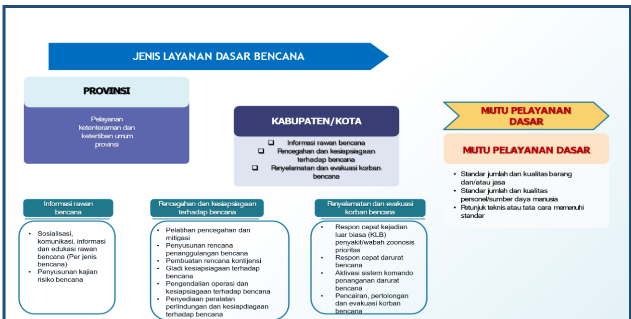
Gambar 1 - Layanan SPM Sub Urusan Bencana

Standar teknis Pelayanan Dasar pada Standar Pelayanan Minimal (SPM) sub-urusan bencana daerah kabupaten/kota disusun untuk memenuhi hak konstitusional Warga Negara, melalui tahapan: